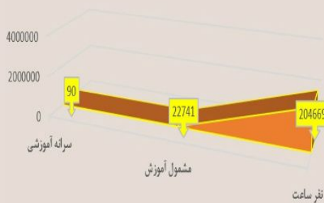
نمودار آمار شاخص های آموزش ضمن خدمت دانشگاه در سال ۱۴۰۱