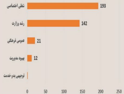
تعداد دوره های آموزشی ضمن خدمت دانشگاه علوم پزشکی تبریز سال ۱۴۰۰